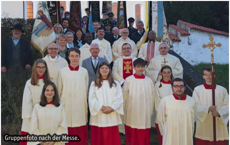
Gruppenfoto nach der Messe.